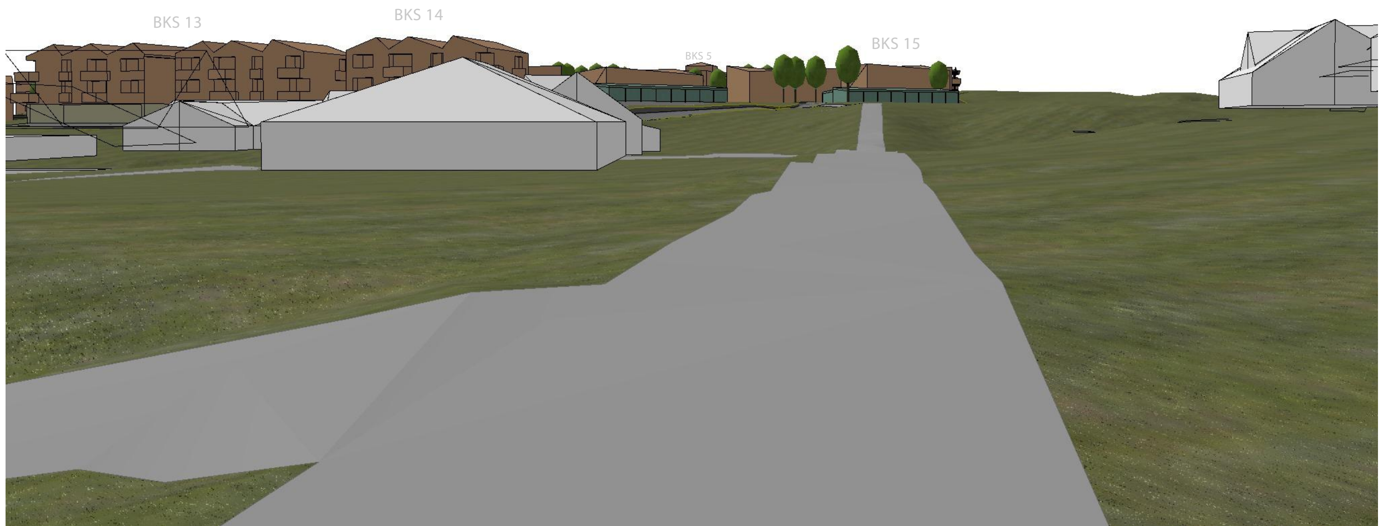
1:200 nr. 6 Fra eksisterende bebyggelse 2

BIM med ArchiCAD 24 NOR Filplassering: X:\Prosjekt\Prosjekt\2020\Orkanger\O20 123 Frey Eiendom AS_Beinskaret regulering\Illustrasjoner\Beinskaret.pln