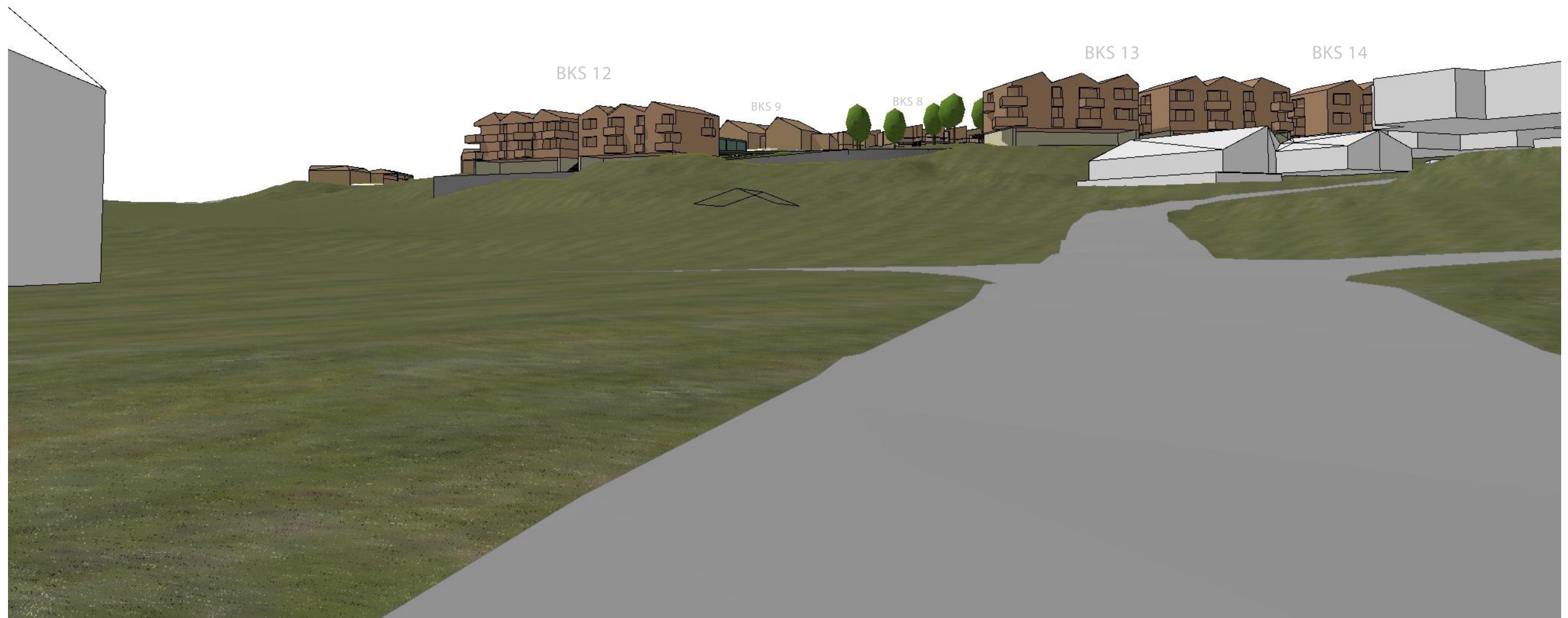
1:200 nr. 5 Fra eksisterende bebyggelse 1

BIM med ArchiCAD 24 NOR Filplassering: X:\Prosjekt\Prosjekt\2020\Orkanger\O20 123 Frey Eiendom AS_Beinskaret regulering\Illustrasjoner\Beinskardet.pln