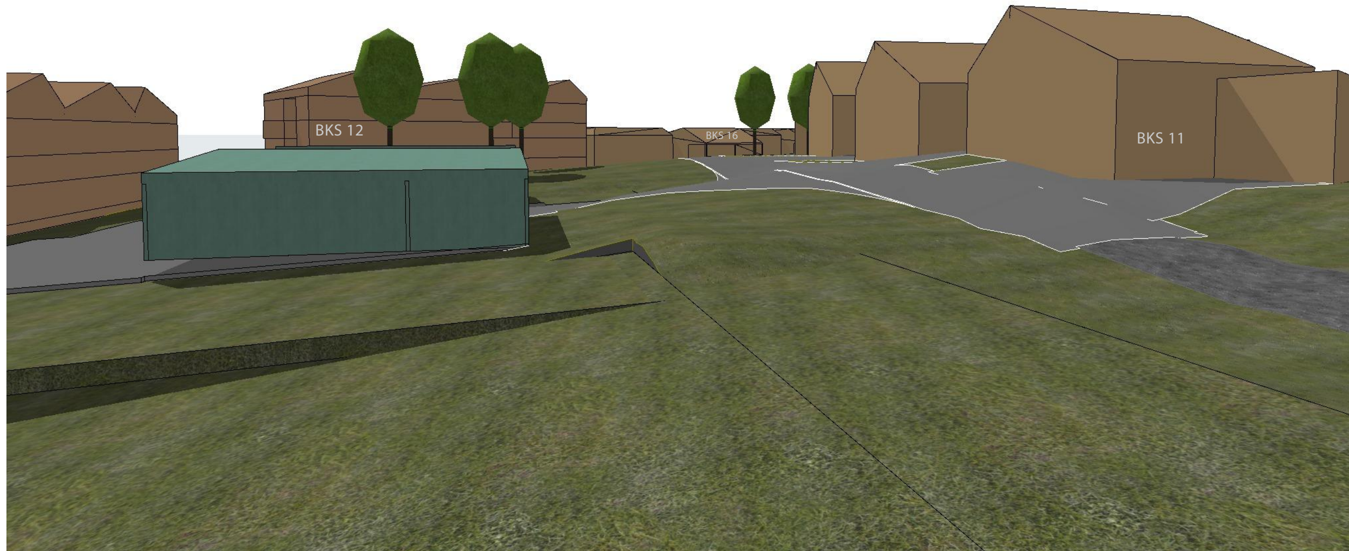
1:200 nr.4 Ny bebyggelse 3 - BKS

BIM med ArchiCAD 24 NOR Filplassering: X:\Prosjekt\Prosjekt2020\Orkanger\O20 123 Frey Eiendom AS_Beinskaret regulering\Illustrasjoner\Beinskardet.pln