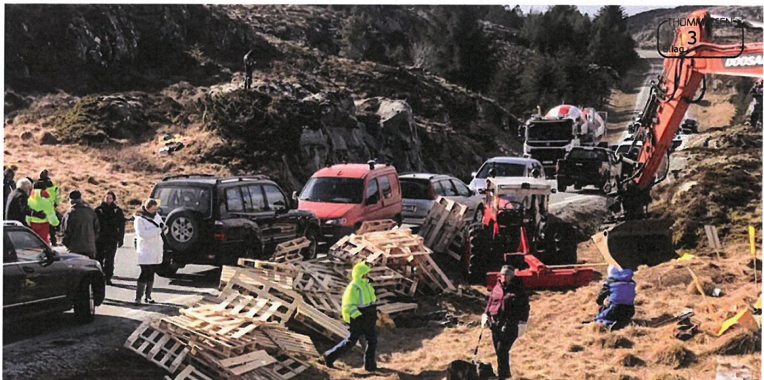
Politiet har bøtelagt demonstrantenes biler som står langs veien på Frøya. Pallene som ble levert av Salmar-eier Gustav Witzøe ble brukt til å hindre anleggstrafikk til å kjøre forbi.