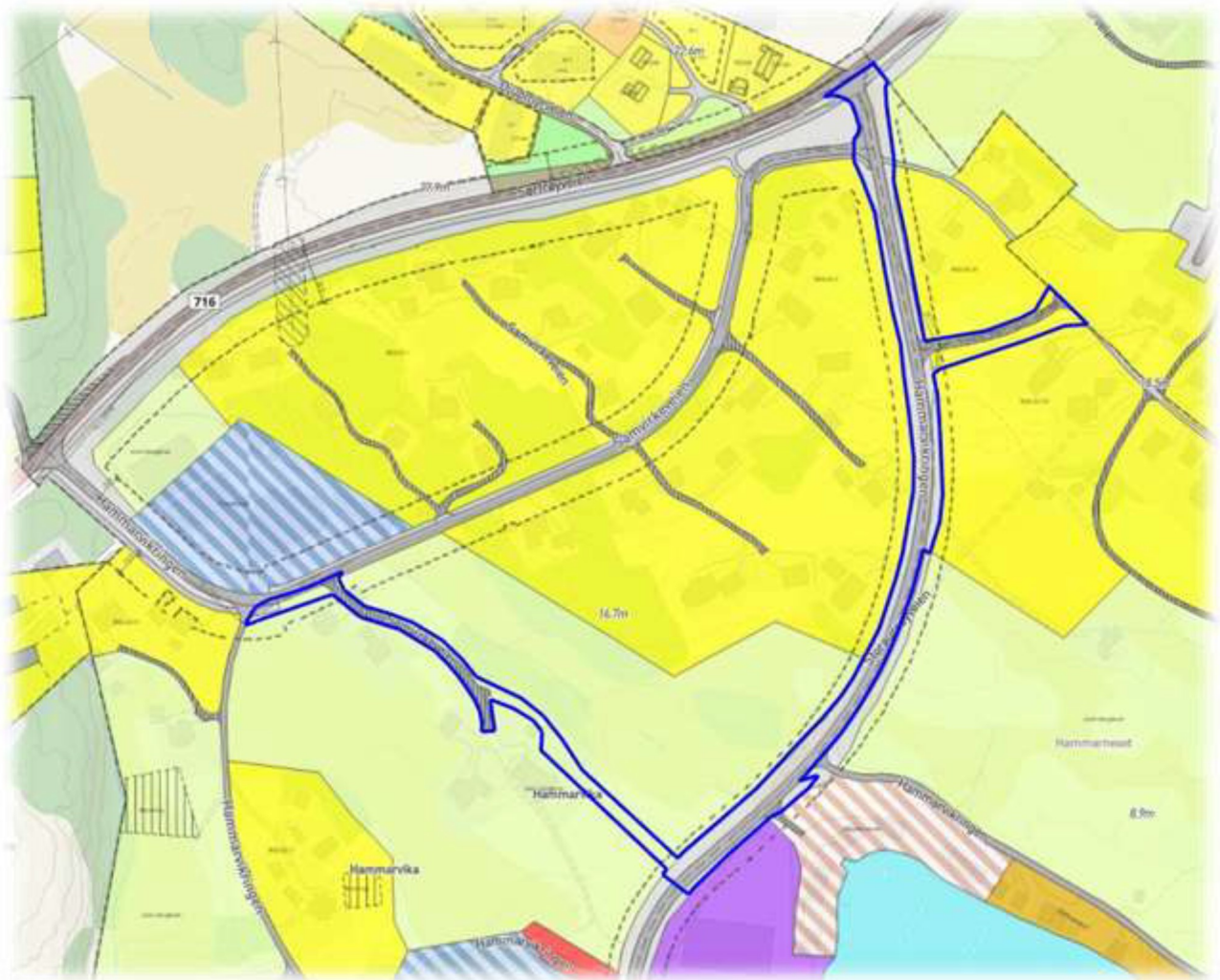
Figur viser planstatus i område

Dagens formål er i hovedsak annen veigrunn med unntak gangstien som er avsatt til jordbruksområde.