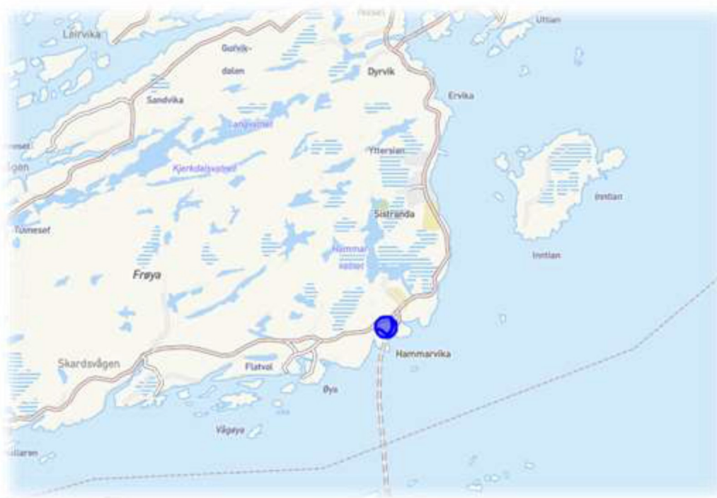
Figur viser oversiktskart

Kystplan AS er engasjert av Frøya kommune til å utarbeide reguleringsplan for fortau og gangsti i Hammarvika.