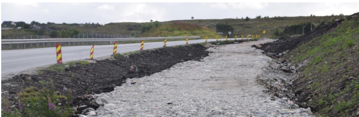
FIGUR 1: BYGGING AV GANG- OG SYKKELSTI HAMMARVIKA-SISTRANDA. FOTO: FROYA.NO

Gjennom dette arbeidet ble Frøya sertifisert som Trafiksikker kommune i 2017, en sertifisering som varer i grove tre år. Det betyr dermed at det vil bli en ny sertifiseringsvurdering i den påbegynte politiske perioden. Det finnes kun seks sertifiserte kommuner i Trøndelag, hvorav alle sammen må gjennom en resertifisering i løpet av de neste årene.