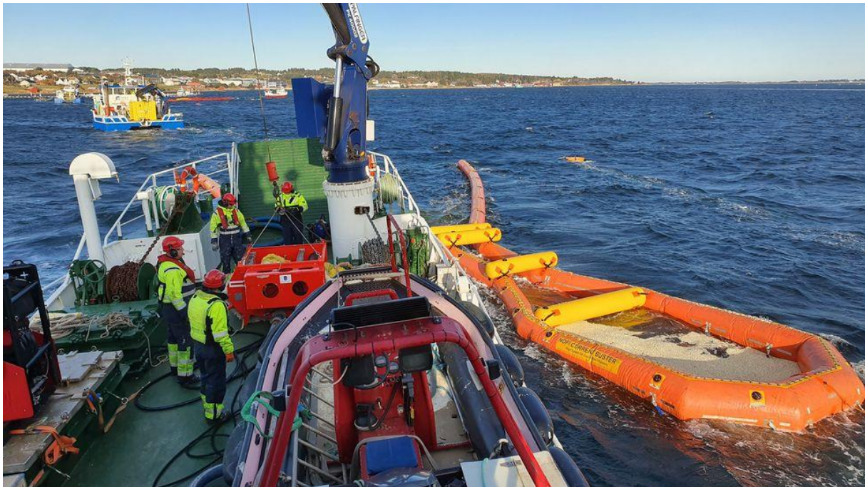
OPPSAMLING AV POPKORN UNDER ØVELSE FROHAVET.

personer på øvelsen. Det ble i tillegg sluppet 40 kubikkmeter med usaltet popkorn for å simulere oljeflakene.