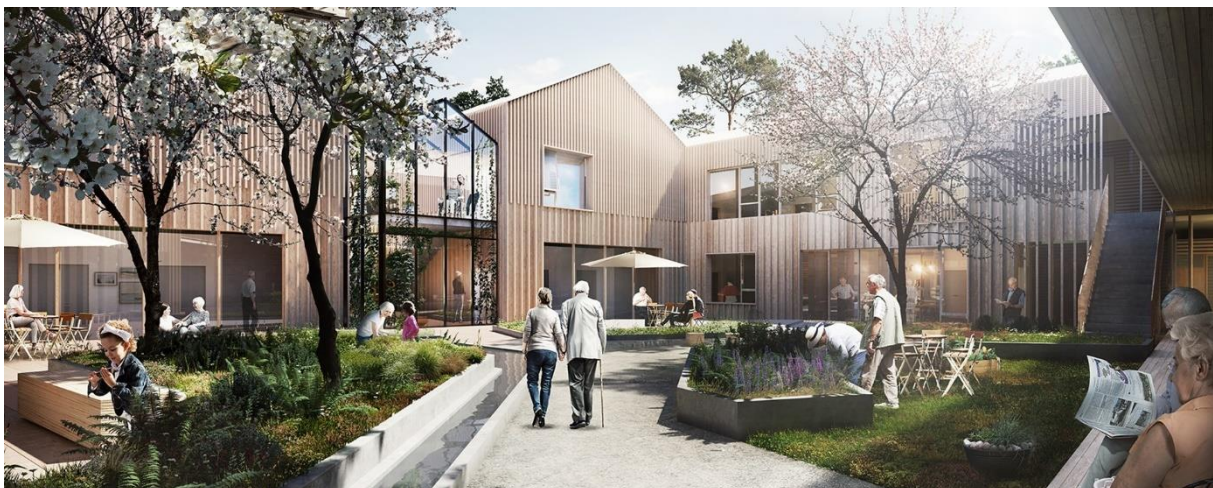
ILLUSTRASJON AV MORGENDAGENS OMSORG.

Frøya kommune gjennomførte i 2015 et prosjekt angående Morgendagens omsorg (MO). Prosjektet ser på en omlegging av pleie- og omsorgstjenestene på bakgrunn av den demografiske utviklingen vi vil få i årene fremover. Det er foretatt utredninger og vurderinger av satsningsområder innenfor sektoren. Disse ble vedtatt i kommunestyret februar 2016. Videre har direkte arbeid med prosjektet, nemlig etableringen av bygningsmassen for MO, startet opp, og er pr.d.d. pågående.