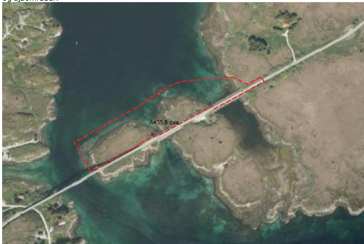
Figur 1 Oversiktsbilde planområdet.

Uttian er flat og har sparsomt med vegetasjon. Planområdet består av lavtliggende kystlynghei og sjøområder.