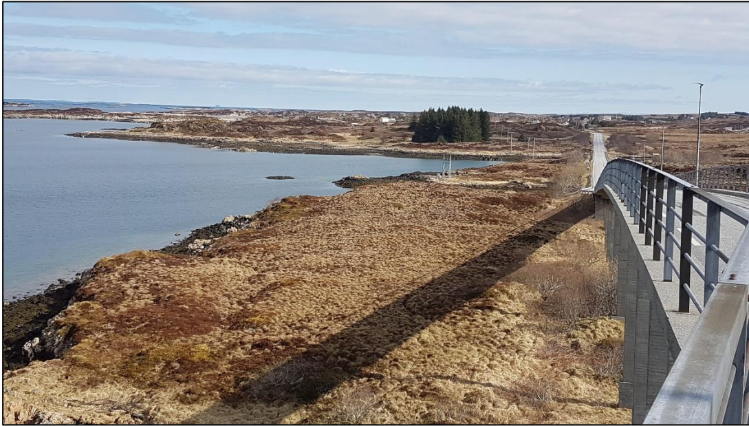
Figur 4: Samme motiv som fig. 3, men med annet utsnitt.