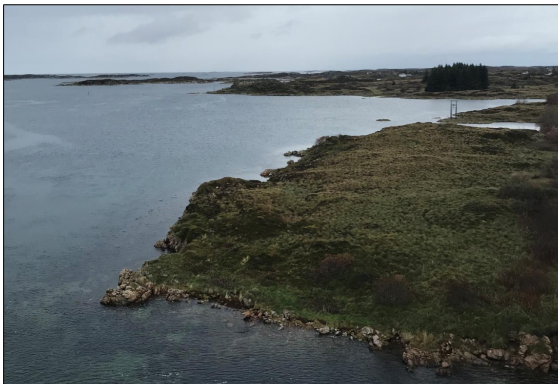
Figur 3: Planområdet sett mot vest fra brua over Ellingsundet

Planområdet ligger like inntil nordsiden av fv. 451 ved brua over Ellingsundet (Dyrviksvaet), som forbinder Uttian med Fastfrøya (Dyrvik). Området ligger på øyene Ellingsøya og Litlsørøya. Mellom disse øyene ligger Litlellingsundet, som fylkesvegen krysser på en kort vegfylling. Vegfylling er det også over det litt bredere sundet mellom Litjsørøya og Uttian i vest. Strandsonen i området er preget av oppsprukket fjell: I buktene er det stedvis grus og sand. Bortsett fra fylkesvegen og en kraftlinje som starter der sjøkabelen kommer opp nord på Litjsørøya er planområdet lite berørt av landskapsinngrep.