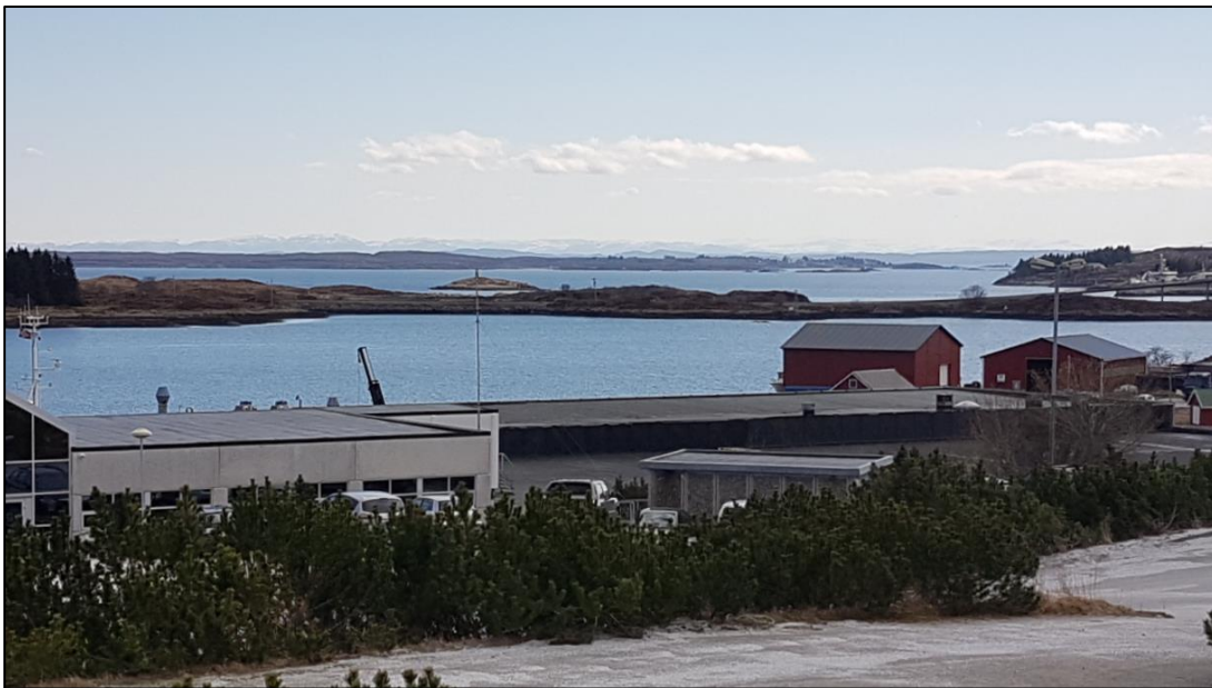
Figur 5: Planområdet på Ellingsøya og Litlsørøya sett fra Frøya næringspark i forgrunnen.