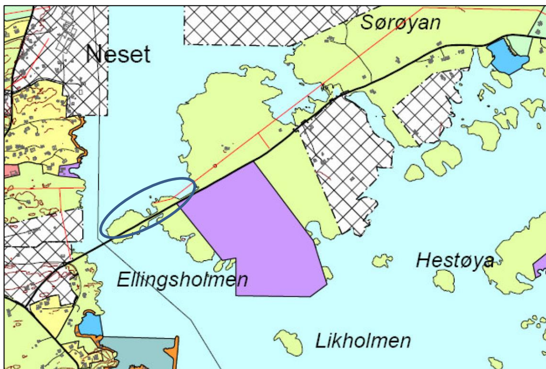
Figur 6: I kommunedelplanens arealdel er det på Sørøya avsatt et areal til industriområde sør for fv. 451 (illa farge). Planområdet for den aktuelle reguleringsplanen er vist med blå oval.

I kommuneplanens arealdel er det aktuelle planområdet for Uttian næringsområde vist som grønt (Landbruk-Natur-Friluftsliv – LNF). Sør for fylkesveg 451 og like inntil planområdet er det imidlertid satt av et areal for framtidig industri (figur 6). Dette området er i dag uaktuelt for denne type arealbruk. Dette betyr at vi må vurdere landskapsvirkningen av reguleringsplanen uten å ta hensyn til allerede vedtatt – men ikke realisert - arealbruk.