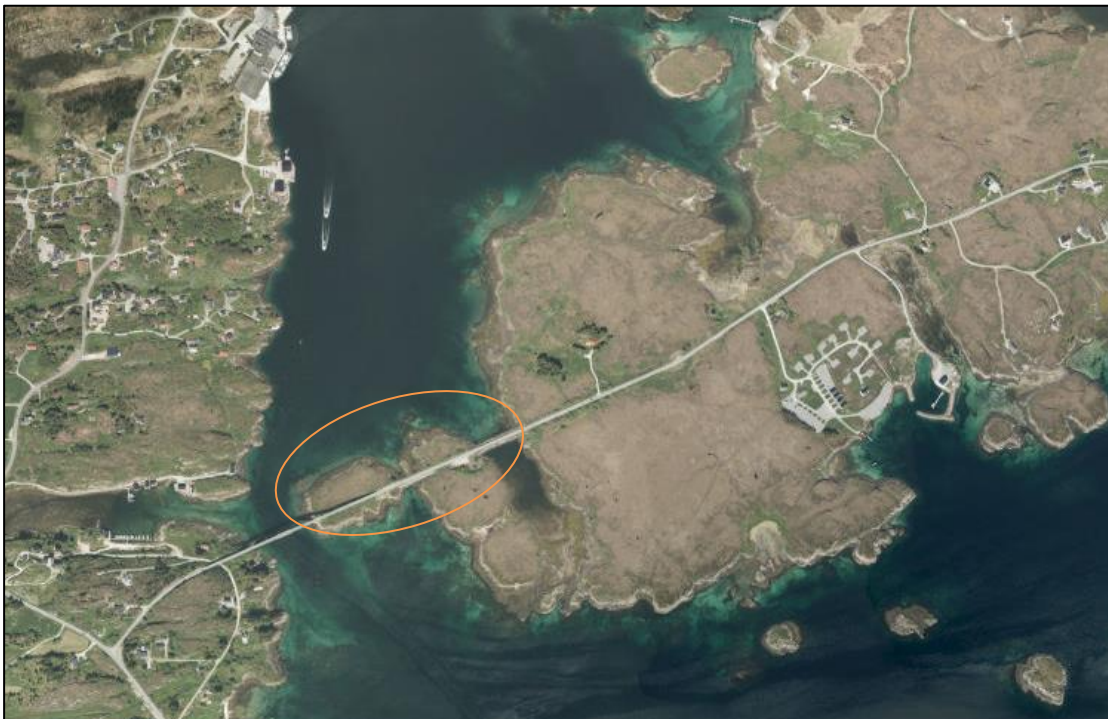
Flyfoto av planområdet ved Ellingsundet (markert med oval).