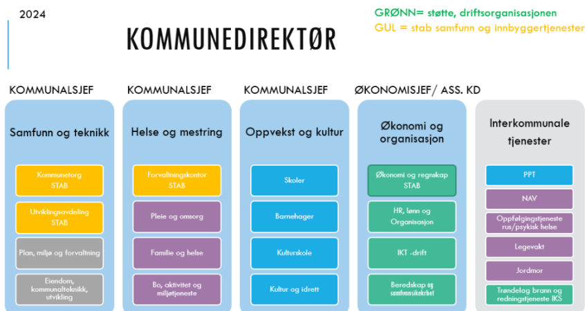
Organiseringen i Frøya kommune pr. 2024