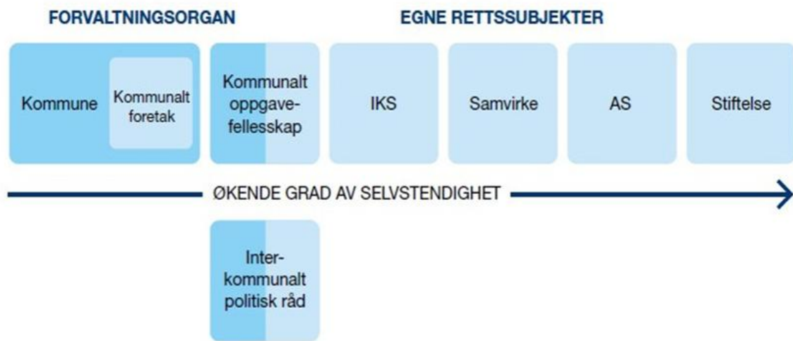
Figur 1: Mulighet for styring og kontroll ved ulike organisasjonsformer (Hentet KS)