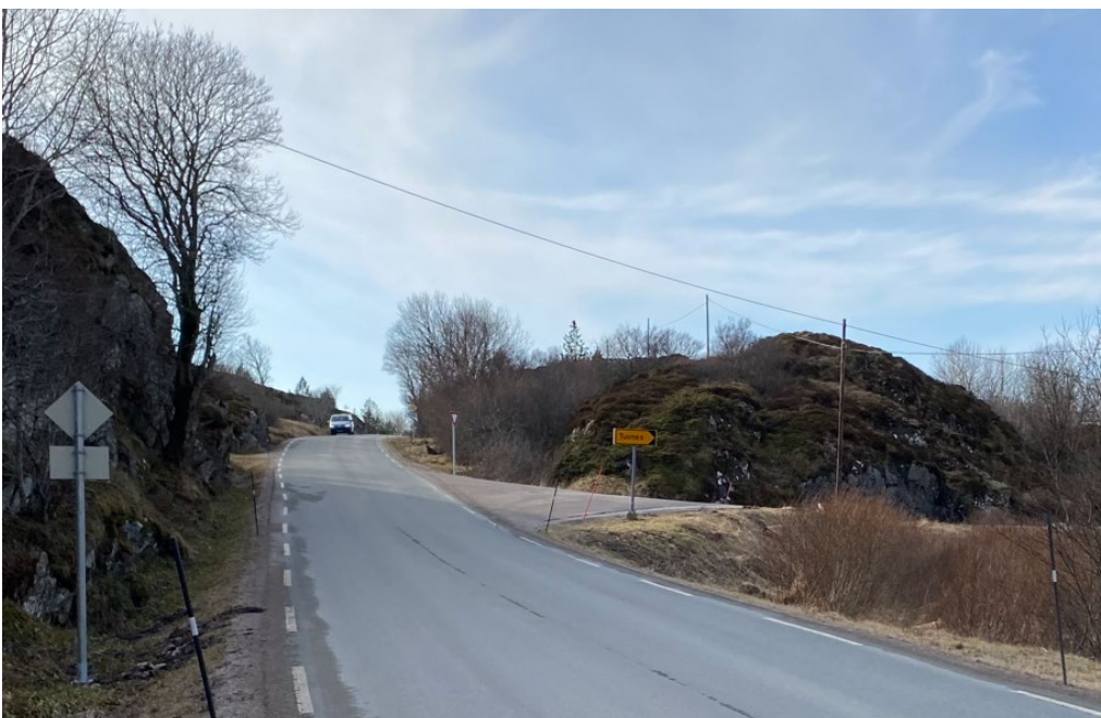
Figur 1: Kryssområdet med høybrekk mot sørvest

I forbindelse med regulering av nye næringsområder ved Tuvneset i Frøya kommune er det sett på kryssområdet der næringsområdet får tilkobling til fylkesveg 716. Trøndelag fylkeskommune har i uttalelse til varsel om planoppstart kommentert at dagens kryss har dårlig sikt mot sørvest, da det er et høybrekk like ved krysset i denne retningen. Trøndelag fylkeskommune ber her om at det defineres rekkefølgebestemmelser som sikrer at krysset opparbeides i henhold til gjeldende krav i N100 før det nye anlegget tas i bruk.